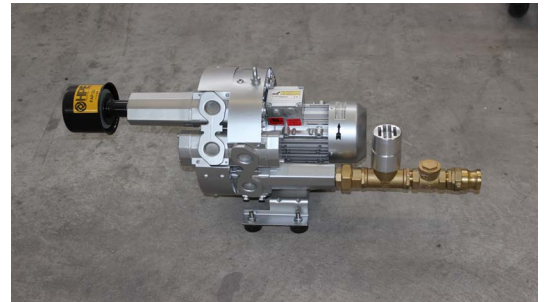
surpresseur à canal latéral