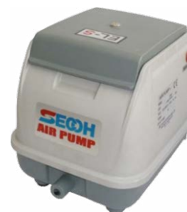
surpresseur à membranes